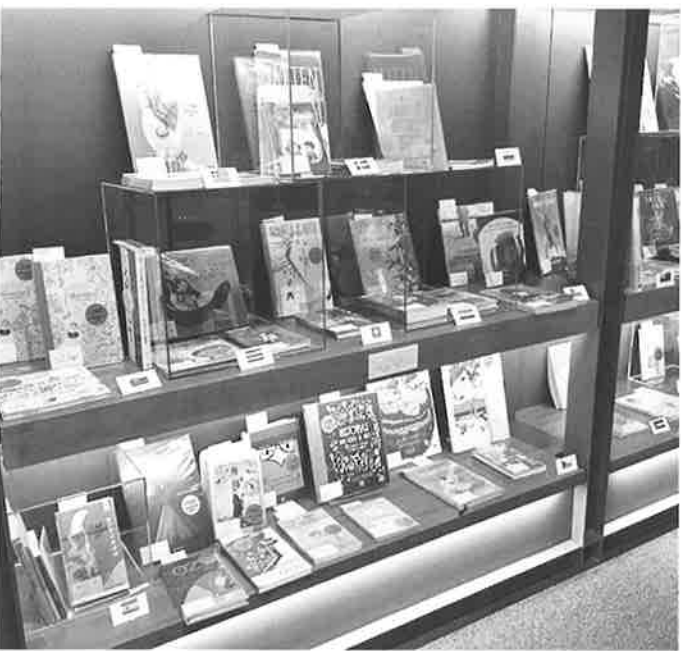
2019年開催の「世界の子どもの本展」の様子

る世界の児童書「国際アンデルセン賞とIBBYオナーリスト2020」(AB判、フルカラー60ページ)をご希望の方は、JB BY事務局までお問い合わせください。(電話 03-6227317703 / info@ibby.org) 英語版のカタログは、IBBYのウェブサイトからPDFでご覧いただけます。