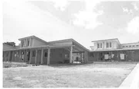
あゆみ学園園舎

けば、ほとんどの子どもが「ルトイン羽生！」と答えると思 います。施設の近くにあるビジ ネスホテルに、日程を分けて、 ユニットごとの小単位での泊 をしました。ホテルの1室で弁 当を食べ、お風呂に入って泊 するだけという、ささやかなイ ベントですが、職員の想像を超 えて、子どもたちはいつもと違 う空間に、大いに喜んで笑顔い