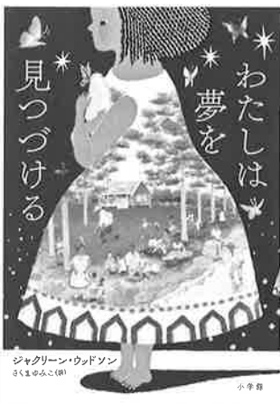
英語版「Brown Girl Dreaming」(2014年刊行)、日本語版『わたしは夢を見つづける』(さくまゆみこ訳、小学館、2021年刊行)

れ世界は広いと改めて感じさせてくれます。そして、今、翻訳者たちがポランティアで、自分の専門とする言語の本の解説動画を作っている、YouTubeのJBBYチャンネルで順次公開する予定です。その道の一流の方々解説で、ますます面白く、ますます多くの学びを得られるのは間違いありません。ぜひ、併せてお楽しみください。