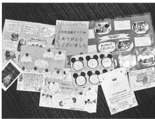
出版クラブに寄せられたたくさんのお礼状

毎晩職員が絵本の読み聞かせをしています。読み終わると「次は私が読む」と子どもたち自身が読み聞かせをするようにもなりました。国語の音読を嫌々している子どもも、この時は楽しそうに読んでいます。本棚の一角には「職員おすすめの本」のコーナーがあり、月替わりでさまざまなジャンルの本に触れる工夫もしています。