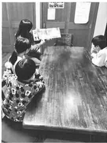
読み聞かせの様子

出版クラブとの関わりは、いつからだろうか？ 東京家庭学校が寄贈図書の中継基地であり、各施設から引き取りに来る配布場所であったこともあり、以前は出版クラブ様から何万冊もの寄贈図書があり、1年に1回トラック数台が施設に横付けされ、配分日に合わせて職員会議を中断し、トラックの荷台から職員総出のりレー方式で、本が沢山入った段